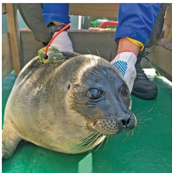
Рис. 1. Байкальская нерпа со спутниковым передатчиком «Пульсар» (ЗАО «Эс-Пас», Россия) системы Argos

Сведения о помеченных нерпах и работе меток приведены в табл. 1.