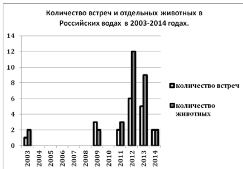
Рис. 1. Количество встреч групп и отдельных особей Японского гладкого кита, зарегистрированных в российских водах в 2003–13 гг.

Figure 1. Number of sightings and individual North Pacific right whales recorded in Russian waters between 2003 and 2014.